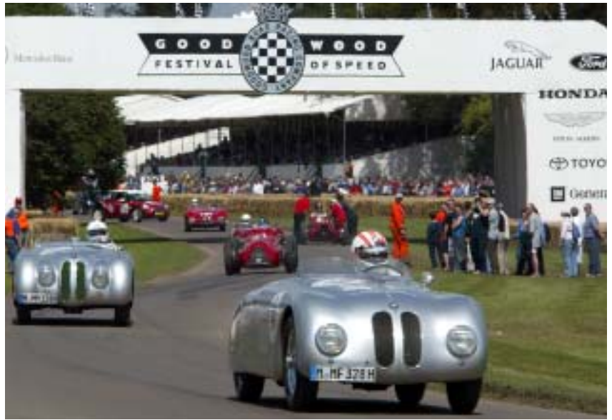
On track: das Goodwood-Rennen 2002.

der R 90 S TT und einem RS 500 Seitenwagengespann. Zum Thema „25 Jahre BMW M1“ startete der ehemalige Formel-1-Pilot Marc Surer auf einem M1 Procar.