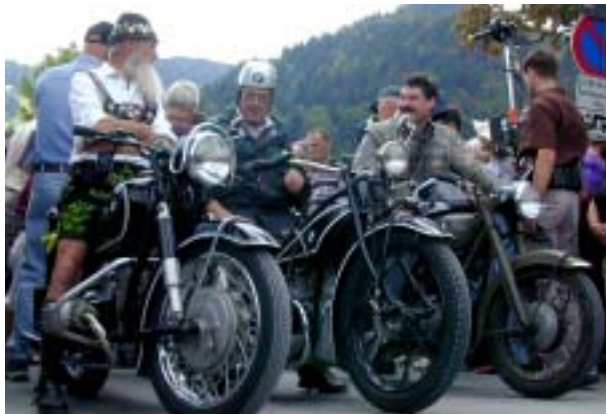
„Come together – Ride now!“ – das Motto für 2003. Rund 28.000 Biker folgten dem Aufruf.

Alle Fahrer historischer Fahrzeuge waren herzlich eingeladen, am Classic Corso teilzunehmen und das einmalige Gefühl zu erleben, gemeinsam mit gleichgesinnten Enthusiasten die Geschichte des Unternehmens in Bewegung zu erleben.