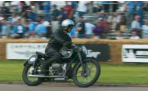
Speed: Der Name ist Programm in Goodwood.

Auch BMW war in den verschiedenen Rennklassen für Automobile und Motorräder mit den Ikonen der BMW Motorsportgeschichte vertreten. Thematisch wurde der BMW Auftritt von den diesjährigen Jubiläen bestimmt. „80 Jahre BMW Motorräder“ war vertreten unter anderem durch den Renneinsatz einer BMW R 37, einer Ex-Georg-Meier Kompressormaschine, der Ex-Walter-Zeller RS 500,