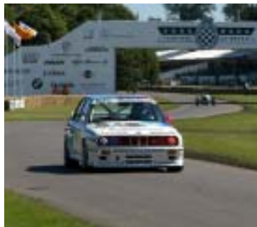
Goodwood: Speed ist Trumpf.

der Sommer ist heiß dieses Jahr – und nicht nur wegen der Temperaturen. Auch die Veranstaltungen der BMW Club Szene haben es wieder in sich. Ob es das rasante Festival of Speed im englischen Goodwood ist oder das dritte Bikermeeting in Garmisch-Partenkirchen, das wieder alle Rekorde bricht. Ob bei