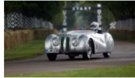
Goodwood Festival of Speed (2002).

Oldtimer sind am schönsten in Bewegung. Um Ihnen möglichst viele Gelegenheiten zu bieten, Ihre eigenen oder fremde Klassiker auf Achse zu sehen, hier ein Überblick über die wichtigsten Veranstaltungen der Oldtimer-Saison 2003.