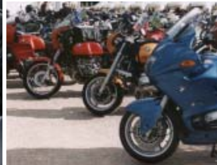
28.000 mal BMW: Bikermeeting 2003.

„Immer höher hinaus“ scheint das Motto für das BMW Motorrad Bikermeeting zu sein. Das dritte Meeting – wieder in Garmisch-Partenkirchen – bot mehr Programm, mehr Besucher und mehr Spaß. Die Tradition spielt zum 80-jährigen Motorradjubiläum eine wichtige Rolle. Hier Impressionen vom Bikermeeting 2003.