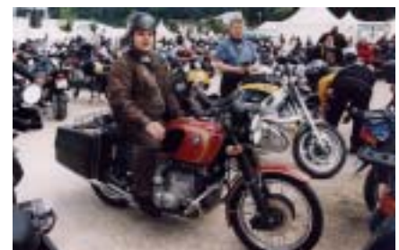
BMW Bikermeeting (2003).