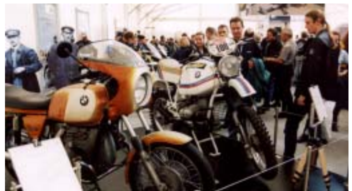
Besuchermagnet: Die Ausstellung „80 Jahre BMW Motorrad“.