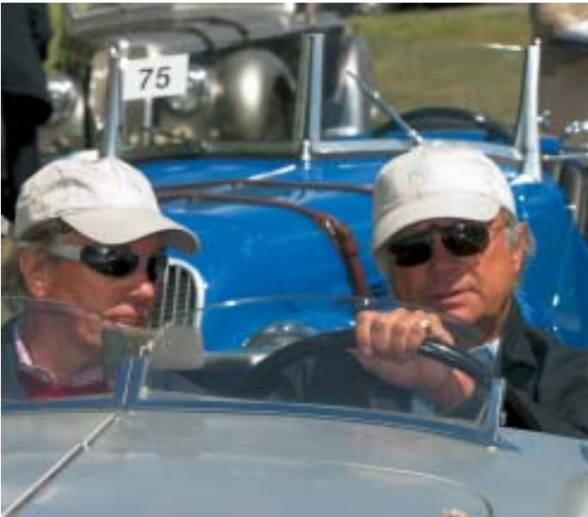
König Carl XVI. Gustaf von Schweden (rechts) mit Co-Pilot Prinz Leopold von Bayern im BMW 328 Berlin-Rom Touring Roadster beim Training zur Mille Miglia 2003.

Besonders hochkarätig präsentierte sich in diesem Jahr das BMW Fahrerfeld. König Carl XVI. Gustaf von Schweden steuerte zusammen mit Prinz Leopold von Bayern einen BMW 328 Berlin-Rom Touring