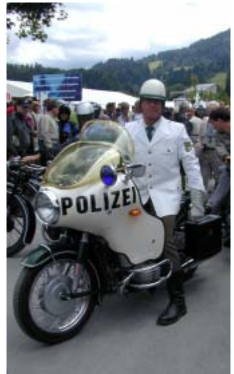
Sogar die Polizei hatte einen klassischen Auftritt.