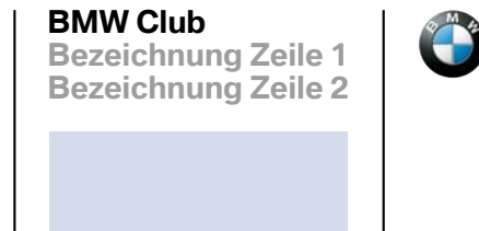
Übertragung in das neue Logodesign