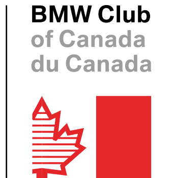
Version 02 Ahornblatt ohne Rundungen