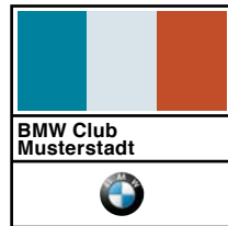
Das alte Logo