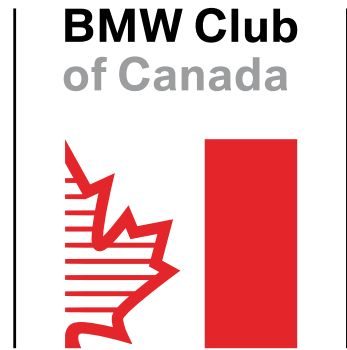
Version 01 Ahornblatt mit Rundungen